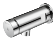
PETIT SC Wandauslauf