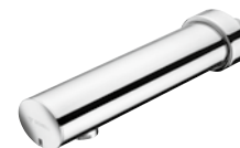
MODUS E Wandauslauf